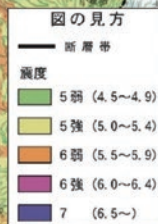
山形盆地断層帯マップ図