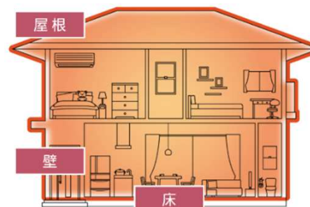
【全体断熱改修】 (壁、床、天井、窓など)

《やまぽっかりノベとは》 国の断熱義務化基準を上回る、 県独自の断熱性能基準「やまぽっか基準」 を満たす断熱改修工事