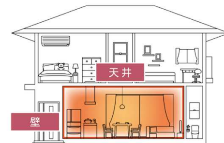
【部分断熱改修】 (「生活空間」に限定した断熱改修)